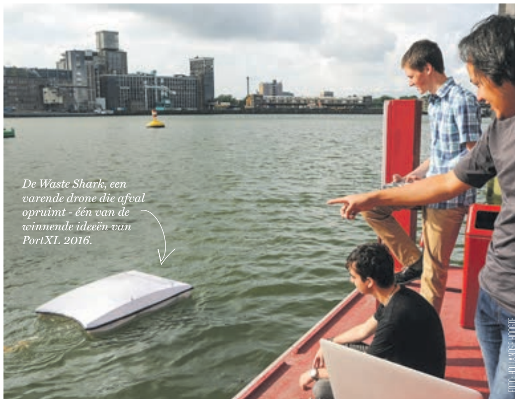
De Waste Shark , een varende drone die afval opruimt - één van de winnende ideeën van PortXL 2016.

Innovatie schept niet alleen nieuwe banen, maar heeft nog meer voordelen, volgens Carolien. De technologieën van de jonge bedrijven dragen bij aan een schonere haven en dus een schonere leefomgeving. 'De waste shark is daar een mooi voorbeeld van. Sinds kort jaagt deze varende drone van onze deelnemer Ranmarine op plastic in de Rotterdamse haven.' De samenwerking